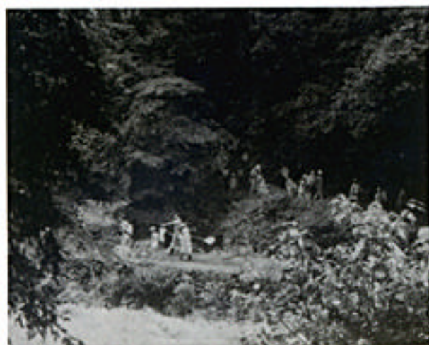
いこいの広場周辺で行われた自然観察会

平成元年度の自然観察会がこのほど行われました。1回目は7月30日、高原町皇子原のいこいの広場が会場です。ここは霧島連山の中でも特に雄大な高千穂の峰の麓で、眼下には狭野杉を見おろす素晴らしい環境のところどころです。ここ