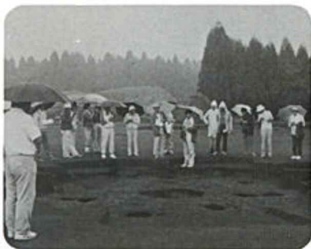
新富町七又木地区遺跡(弥生時代後期)

本年度は、博物館公開講座「森の学習会」を12回開講します。この講座は、県民の方々の文化活動の広がりに応じて多くの学習の場をつくる目的で、県教育委員会の生涯学習広域事業の