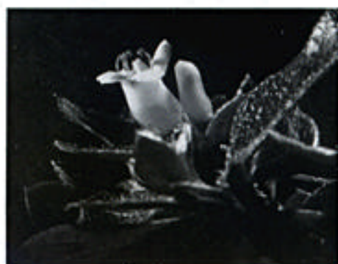
ツクシコメツツジ

ツクシコメツツジは宮崎県と大分県の県境に広がる岩場の多い山岳地帯に、イチフサコメツツジは熊本県境の山地に自生しています。花は白く、米粒ほどしかありません。いずれも、他のコメツツジ類がこれらの山地で隔離され、種分化したものと考えられます。自生地への保護が望まれます。（南谷）