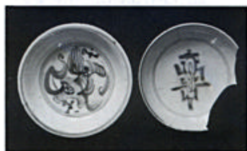
中国から輸入された染付絵皿（16世紀） 〔野尻町角内出土〕

上釉のかかった、美しい光沢の碗や皿を初めて目にした人々は、宝物を手にしたような気持ちになったかもしれません。まして、それが中国舶来のものであれば、なおさらだったことでしょう。近年、本県でも備前焼・常滑焼をはじめとする中世の国産陶器に混じって、青磁・白磁・染付など中国産の輸入陶磁器が山城、集落跡などからたくさん出土しています。17世紀になって肥前の有田で初めて国産化される磁器は、本県では小峰焼（延岡市）など、肥前陶磁器の影響を受けた窯がきづかれて、碗や皿などの日用雑器が生産されました。これらの製品には、草木、山水図など日本的な意匠が描かれ、素朴でほのぼのとした庶民的な味わいを醸しだしています。（近藤）