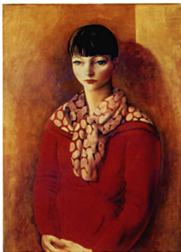
「赤い服を着たモンマルナスのキキ」モイーズ・キスリング