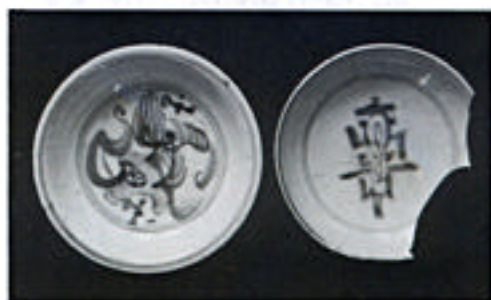
中国から輸入された染付絵皿（16世紀） 〔野尻町角内出土〕