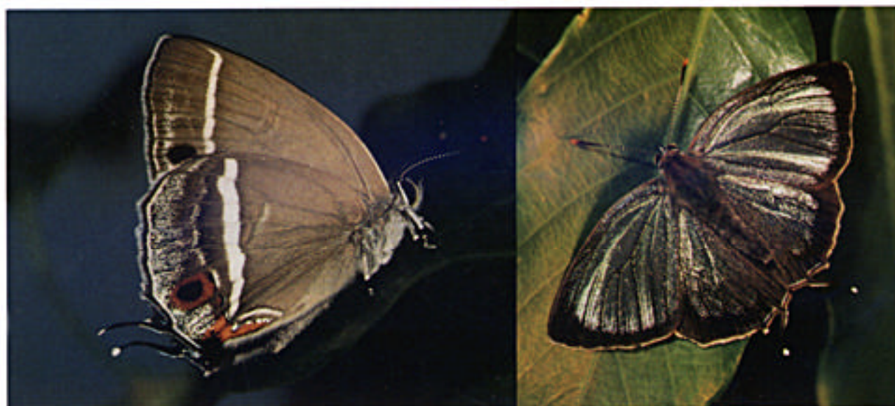
照葉樹林の珍チョウ ヒサマツミドリシジミ

昆虫の中でもチョウ類は、昔から身近な生き物として、愛され親しまれてきました。そのチョウの分布や生活は永い歴史のなかでつくられてきたものであり、それぞれの種類で独特の特徴を持っています。昆虫類の中では、最も研究の進んだグループのひとつですが、まだまだ未知の部分が多く魅力ある存在となっています。また、チョウのはねや形・色彩はさまざまで、自然の造形物としての美しさも兼ね備えています。