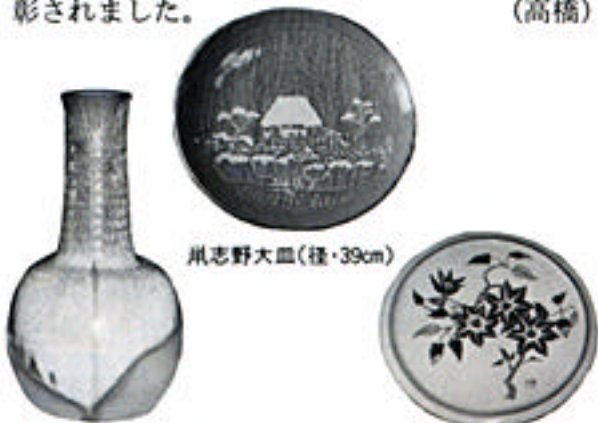
長首花入(高さ・24.5cm、径・12cm)