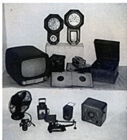
さまざまな庶民生活資料