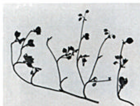
ヒロハドウダンツツジ(宮崎県唯一の採集)

オオトモエソウのような絶滅が危惧され、見ることが難しくなった植物がかなり含まれており、これらがかつては身近な植物であったことを何わせてくれます。（南谷）