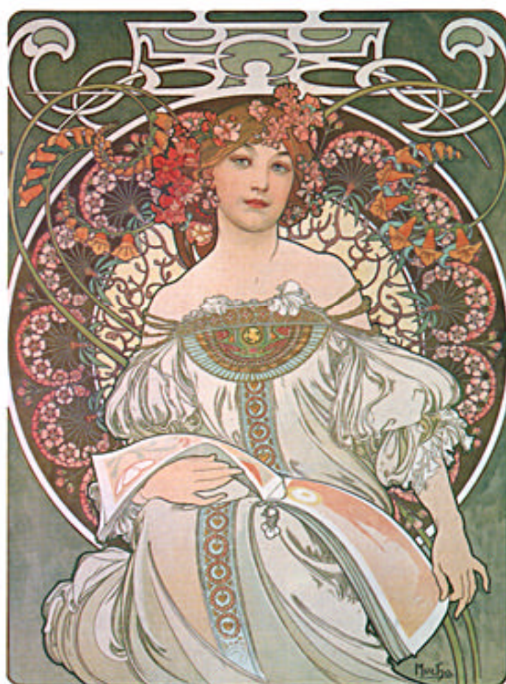
夢 (カラー・リトグラフ)

油彩画、水彩画、パステル画、リトグラフ、ブロンズ、アクセサリー、書籍等約260点。(高橋)