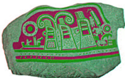
福岡県珍敷塚古墳の壁画(復元図)(6世紀後半)