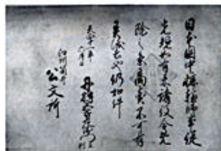
木地師文書「天正十一年六月」