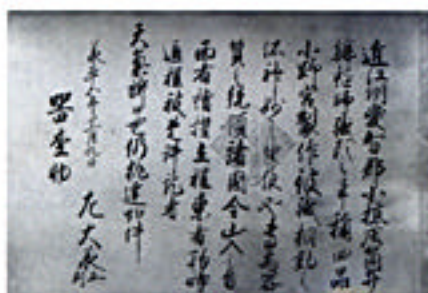
木地師文書「承平五年十一月九日」

西臼杵郡五ヶ瀬町には、先祖代々、受け継がれてきた木地師用具や木地師文書が大切に残されています。