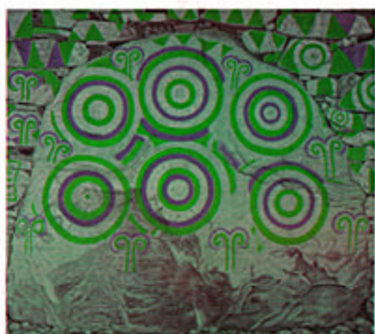
福岡県日ノ岡古墳の壁画(復元図)(6世紀前半)