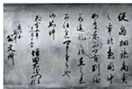
木地師文書「天正十五年十一月十五日」

仕事の様子やその価値を広く紹介するために、今回、文書資料の複製製作を行いました。