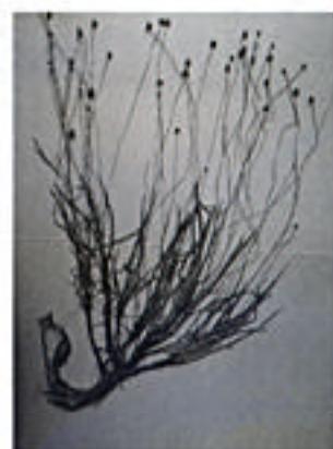
エダウチシロホシクサ (新種)