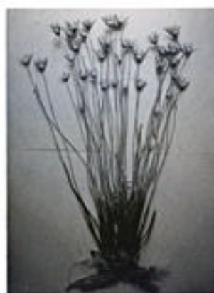
ホウキボシイヌノヒゲ (新種)