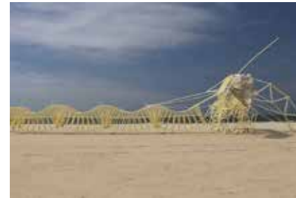
《アニマリリス・ムルス》2017年