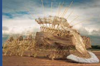
《アニマリリス・ベルシビエーレ・プリムス》2006年