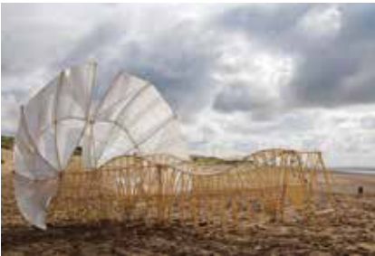
《アニマリリス・ウミナミ》2017年