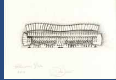
テオ・ヤンセンのスケッチ / 2013年