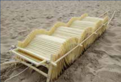
《アニマリリス・カリブス》2018年