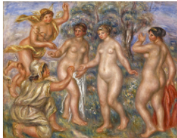
オーギュスト・ルノワール「パリスの審判」 1913-14年頃、ひろしま美術館