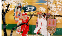
益田玉城「錦帯橋」(部分)

名品セレクションⅠ + 装いの表現 宮崎の美術 - 特集 益田玉城 追悼 彌勒祐徳と西都の作家たち 私の中の瑠九 イタリア彫刻 - 師との出会い