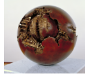
アルナルド・ボモドロ「球体をもった球体」