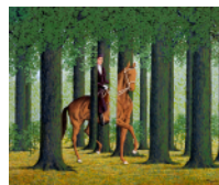
ルネ・マグリット「白紙委任状」