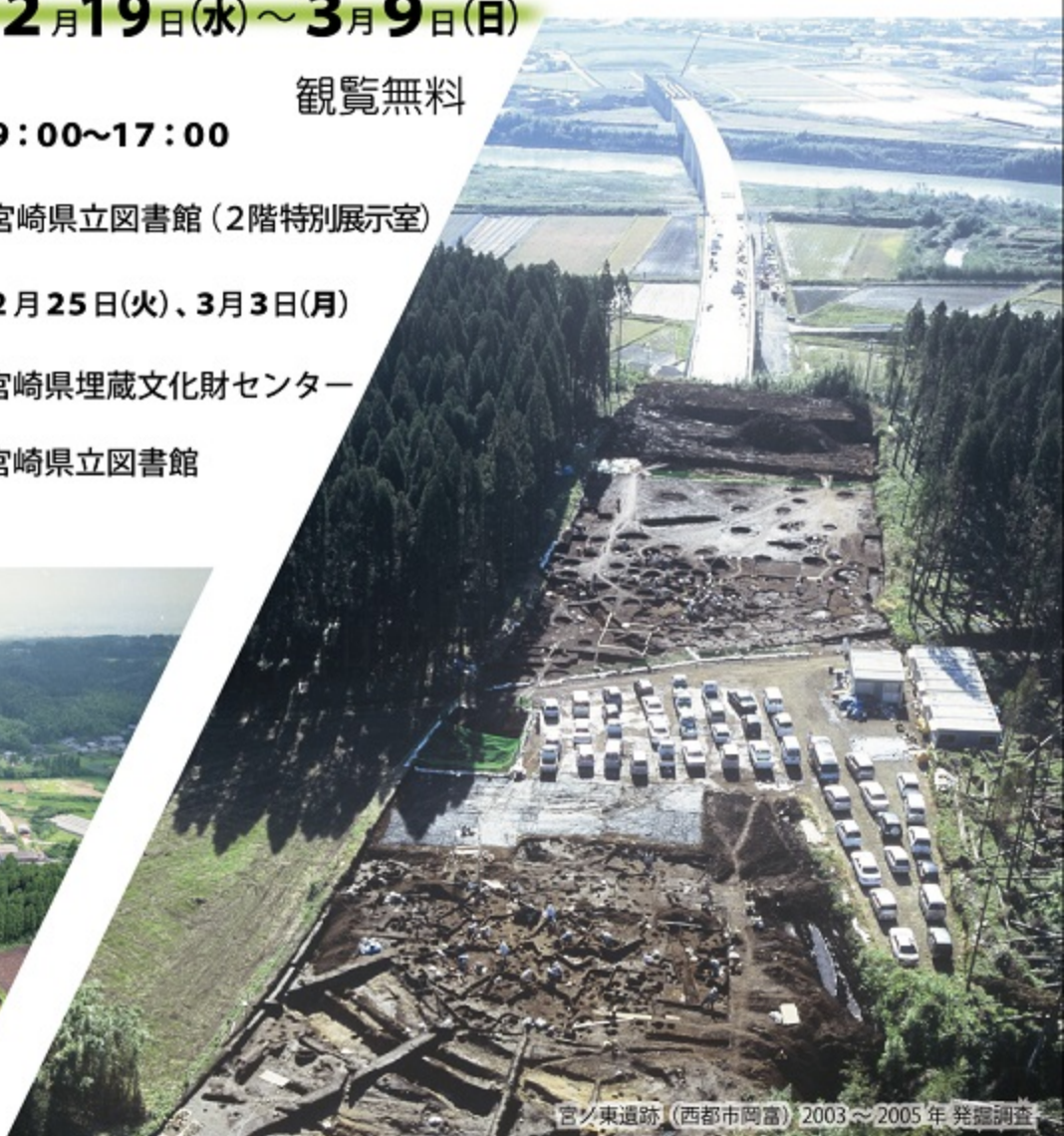
宮ノ東遺跡 (西都市岡富) 2003～2005年発掘調査