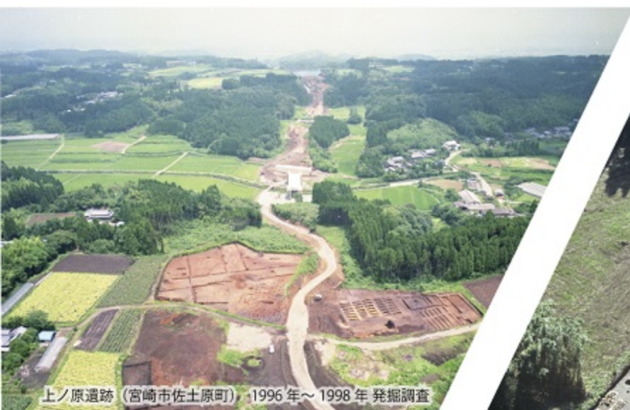
上ノ原遺跡 (宮崎市佐土原町) 1996年～1998年発掘調査