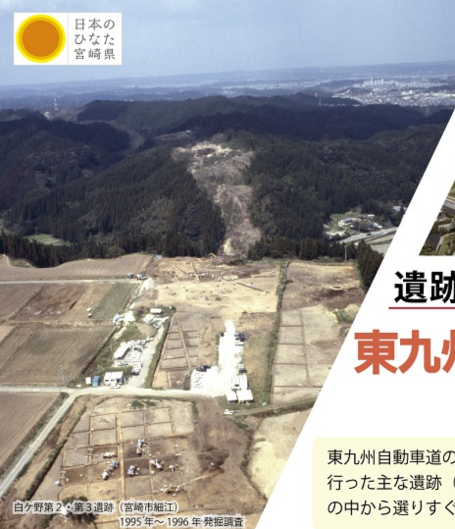
白ヶ野第2・第3遺跡 (宮崎市細江) 1995年～1996年発掘調査