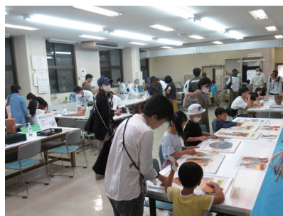
土器復元体験・石器レプリカ製作等