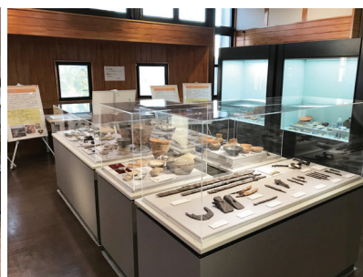
展示会場（西都会場）