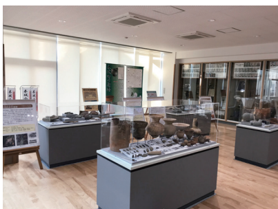
展示会場（木城会場）