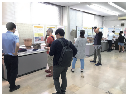
展示会場（高原会場）