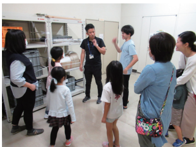
バックヤード見学