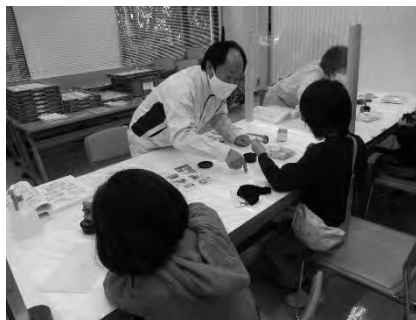
施設公開（土器拓本体験）