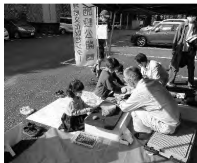
施設公開（ドングリつぶし体験）