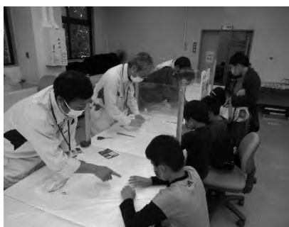
施設公開（石器レプリカ作り）