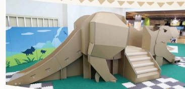
ティラノサウルスすべり台