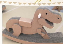
ティラノサウルス木馬